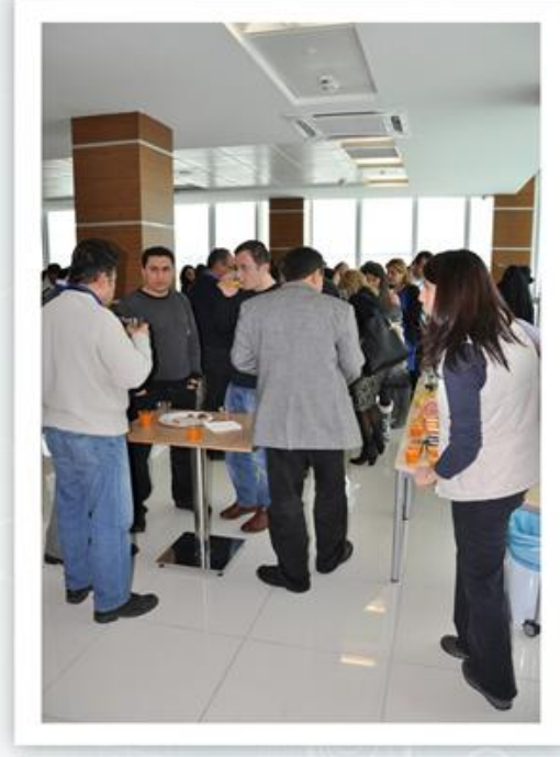
Toplantı Arası Paylaşımları