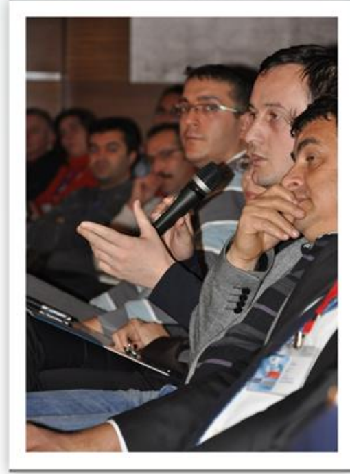
Toplantıya Katılan Öğretmenlerimiz